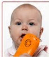
Fotoğrafta nesne bulunması