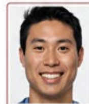
Gülümseyerek poz verilmesi