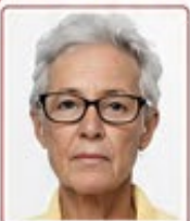
Gözlük takılmış olması

KABUL EDİLMEYEN FOTOĞRAFLAR – Aşağıdaki özelliklere sahip fotoğraflar kabul edilmez.