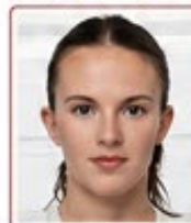
Çizgi, leke veya baskı hataları