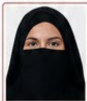
Yüzün kısmen kapalı olması